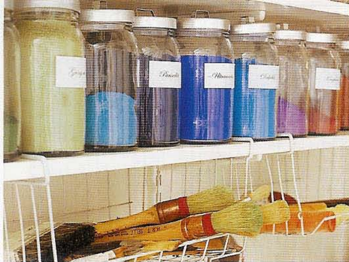
Burkar med färgpigment står på rad längs väggarna i verkstaden.

dekoremålari hon ville syssla med höll hon på mycket med teater. Hon gick Calle Flygare teaterskola och fick måla mycket kulisser.