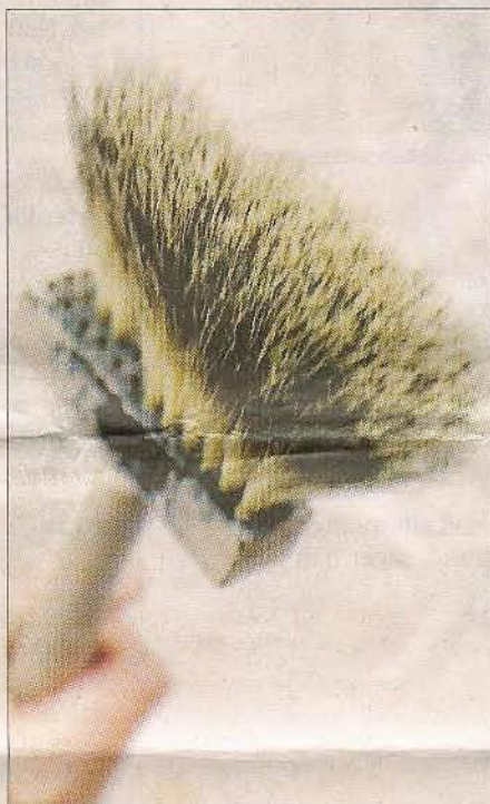
Värd pengarna. Penseln av äkta grävlingshår kostar en slant, men är värd sitt pris.

– Det bästa med jobbet är att vi får se så många olika miljöer. Det är allt från blästill till Armani. Ena dagen sitter vi och fikar i en byggbarack och andra dricker vi