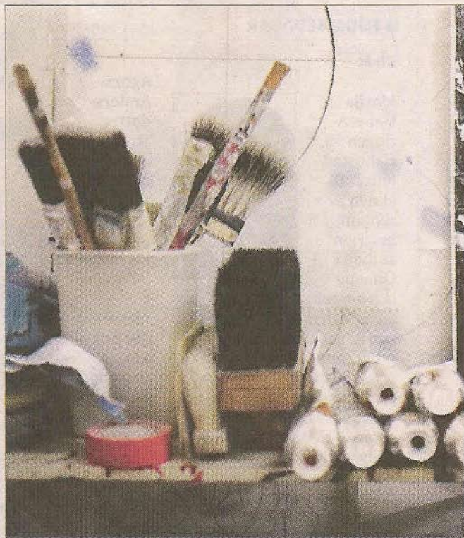
Penslar i alla storlekar. Dekorationsmålaren måste vara konstnärlig och behärska färglära och komposition. De är ju konst som målas direkt på väggen.